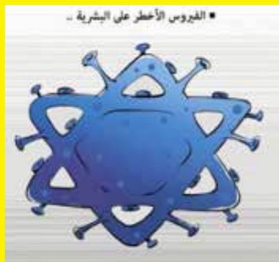
“El virus más peligroso para la humanidad” – caricatura en un diario palestino-gazano