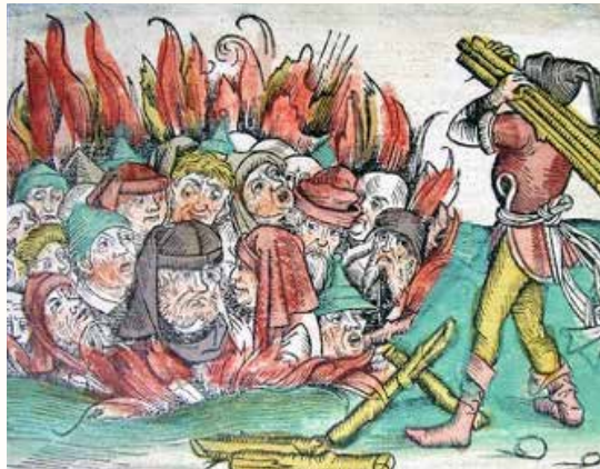
Un dibujo del siglo XIV representa a judíos quemados vivos durante la Peste Negra.

Esto sucedió en la Edad Media, antes de que los científicos modernos comprendieran que los virus y las bacterias causan enfermedades. En ese momento, la superstición llenaba ese vacío.