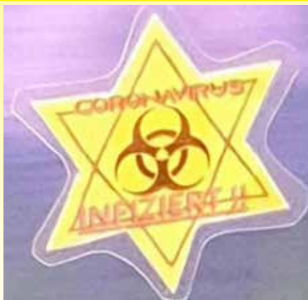
Calcomanía neonazi en Alemania